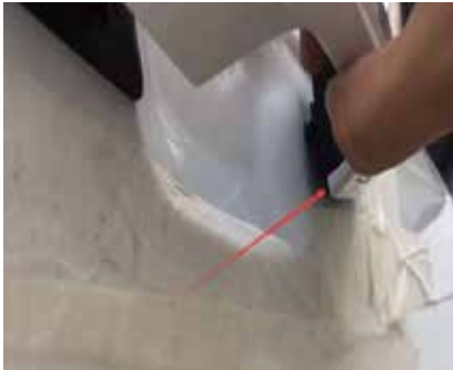
10.把门把手螺丝拆下