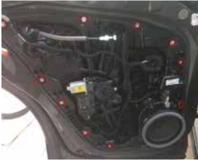
7.把此处的螺丝拆下