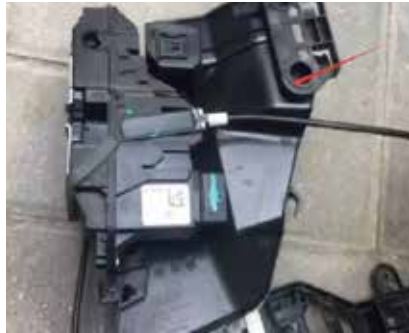
11.内门板、锁、门把手同时拆下来