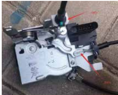
14.内把手拉线，外把手拉线安装到我司的锁上