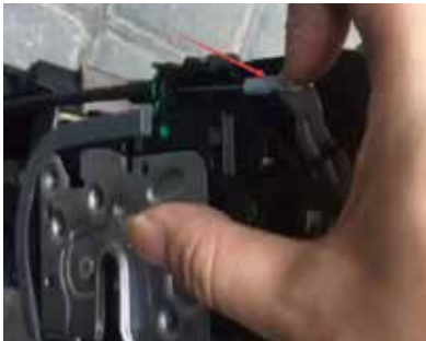
13.把原车外把手拉线拔掉