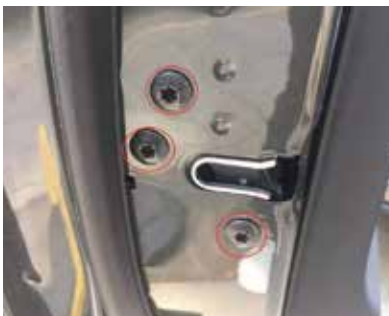
16.把锁安装到原车上，用原车螺丝固定