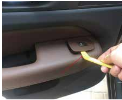
2.用翘刀把此处翘开