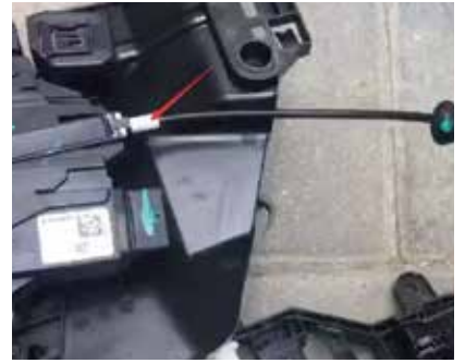
12.把原车内把手拔掉