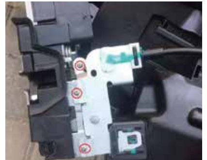
15.把我司锁固定到原车锁上