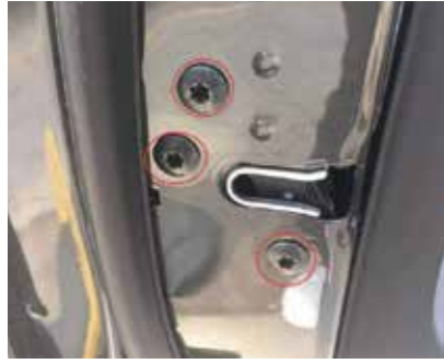
8.把原车锁螺丝拆下