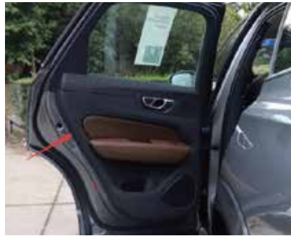
19.检验合格将门板复原