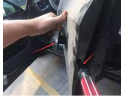
9.用一字螺丝刀，用把卡扣按进去，用力拉外把手，然后再复位一下外把手