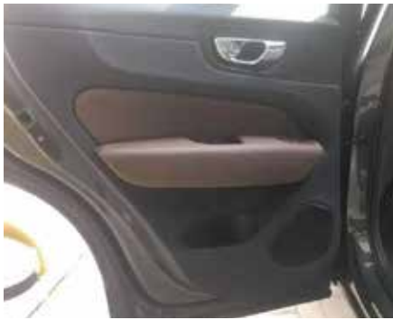
1.左右前门安装步骤