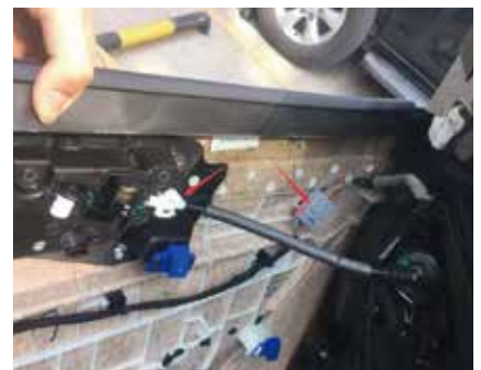
6.把饰板上的插头，扣子拔掉，拆下外饰板